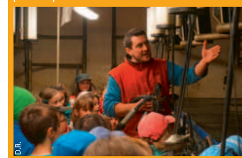
Visite d'une ferme pour l'école de Serraval (ci-dessous) et participation de la classe

Deux classes de l'école de Serraval (Grande section/CP et CP/CE1) ont participé à l'opération « Un berger dans mon école ». Ils ont reçu la visite d'un berger et sont allés visiter une ferme d'élevage. Pour la journée de partage au Villard-sur-Thône avec les autres écoles, les classes ont conçu et réalisé deux jeux : un jeu Questions pour un reblochon , sur le principe de Questions pour un champion , et La grande loterie. Le principe : tourner une roue pour tirer au sort un thème et répondre à une question. Ce jour là, chaque école tenait un stand et proposait aux autres de jouer à ses jeux.